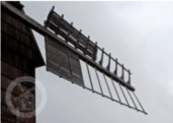
Současné fotografie - technologické vybavení