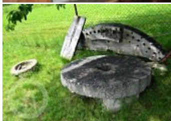
Současné fotografie - exteriér - detaily stavebních prvků