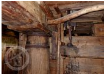
Současné fotografie - technologické vybavení