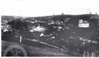
Obč. 1. Pohled na část mlýna na Straně vlněná krajina na Vysočině c. 1910 Karel F. Hájek