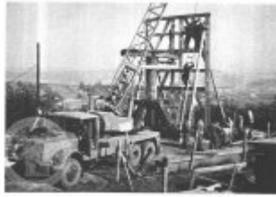
Obč. 11. Vlněná krajina vlněná krajina