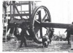
Obč. 12. Převod křížem v patřičném mlýně