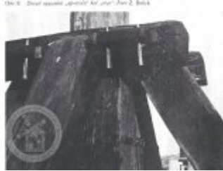
Obč. 6. Detail stavby „převod“ na jímě?