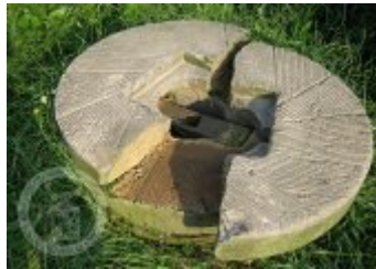
Současné fotografie -