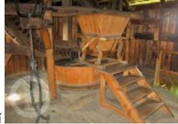
Současné fotografie - technologické vybavení