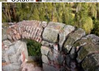
Současné fotografie - objekt