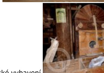
Současné fotografie - technologické vybavení