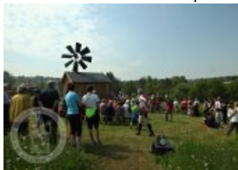
Současné fotografie - objekt v krajině