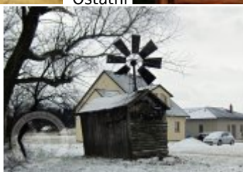
fotografie a pohlednice