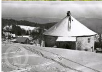
Současné fotografie - exteriér