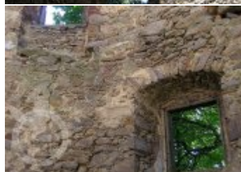
Současné fotografie - interiér - detaily stavebních prvků