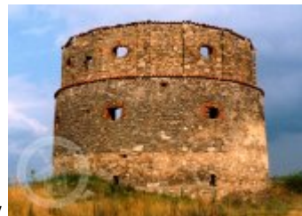
Současné fotografie -

Literatura a pramenyZajímavostiOstatníFotogalerieZákladní obrázky