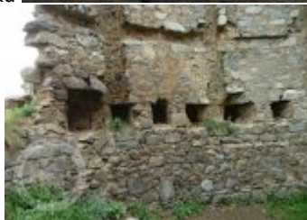
Současné fotografie - objekt v krajině