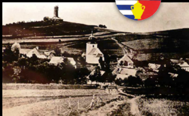
Sulík – na historické pohlednici je nápadná atypická spodní část objektu, podle podlouhlého půdorysu by to mohla být pila s katrem na větrný pohon.