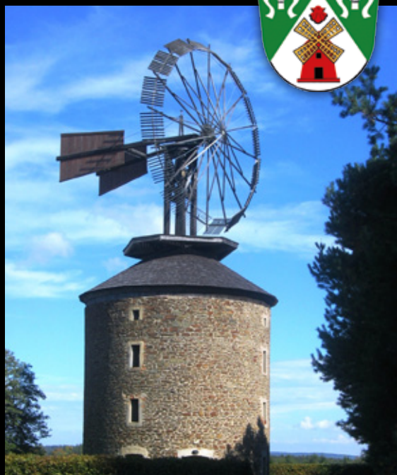
Ruprechtov – větrný mlýn s unikátní Halladayovou turbínou, jedinou na větrném mlýnu v Evropě