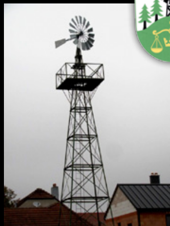
Stožár větrného čerpadla v Chlumu u Třebíče