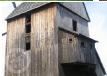
Současné fotografie - objekt v krajině