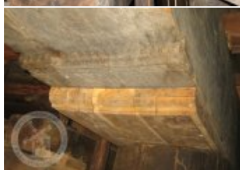
Současné fotografie - interiér