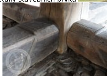
Současné fotografie -