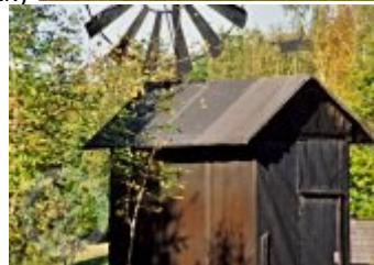
Současné fotografie -