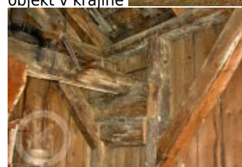
Současné fotografie - technologické vybavení