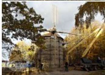
Současné fotografie - technologické vybavení