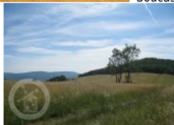
Současné fotografie - objekt v krajině