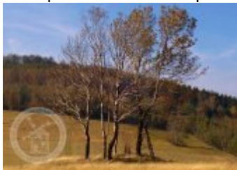
Dolního Vítkova a z kroniky farní. Fotogalerie Základní obrázky