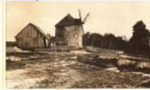
Konec státního mlýna v Sobotce byl v roce 1912 v Sobotce, kdy se došlo k 18. srpnu 1912. V roce 1912 byl mlýn v Sobotce, který byl v Sobotce v roce 1912. V roce 1912 byl mlýn v Sobotce, který byl v Sobotce v roce 1912.