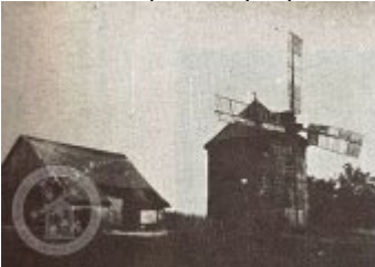
ČESKÉ VĚTRNÍKY III. — VĚTRNÍK U SOBOTKY

Literatura a prameny Zajímavosti Ostatní Foto galerie Historické fotografie a pohlednice