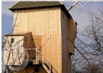
Současné fotografie - exteriér