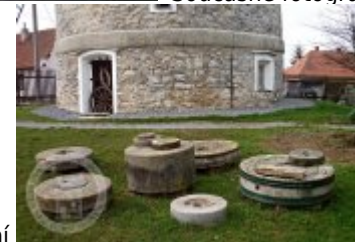
Současné fotografie - technologické vybavení