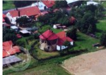
Současné fotografie - objekt v krajině