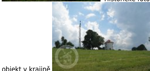
objekt v krajině