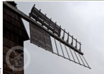
Současné fotografie - technologické vybavení