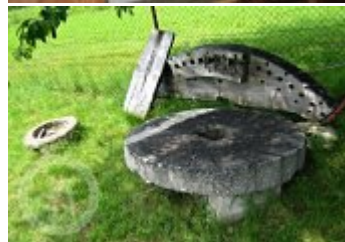
Současné fotografie - exteriér - detaily stavebních prvků