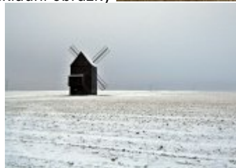
Současné fotografie - objekt v krajině