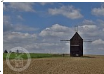
vzduchem-se-uplatnila-take-u-historickyh-mlynu/3591/ Fotogalerie Základní obrázky

http://www.propamatky.info/cs/zpravodajstvi/cela-cr/tipy-a-inspirace/zpravy-z-katalogu-sluzeb-%7C-metoda-sanace-horkym-