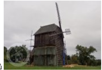
Současné fotografie - exteriér - detaily stavebních prvků