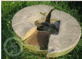
Současné fotografie - interiér - detaily stavebních prvků