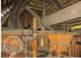
Současné fotografie -