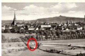
Plzeň - výhled od nádraží