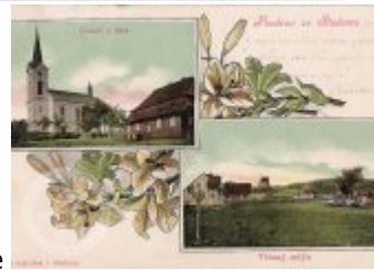
Historické fotografie a pohlednice