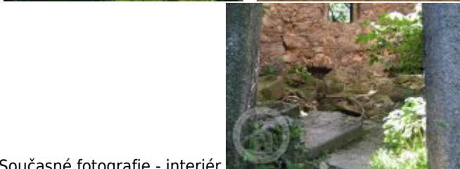
Současné fotografie - interiér