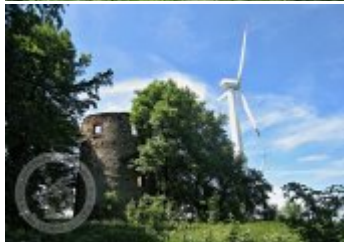
Současné fotografie - objekt v krajině