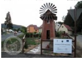
fotografie - exteriér